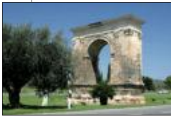
Arc de Barà (Roda de Barà)