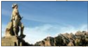
El timbal del Bruc