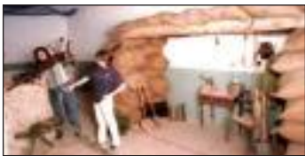
Museo de la batalla del Ebro (Gandesa)