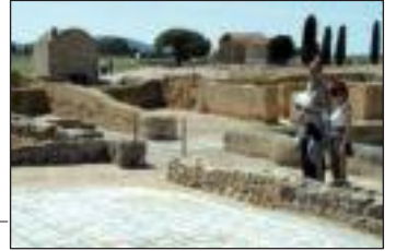
Ruinas grecorromanas (Empúries)