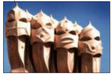
Chimeneas de La Pedrera, de Gaudí (Barcelona)